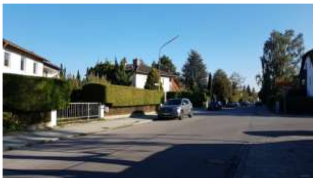
Bauseweinallee Richtung Süden