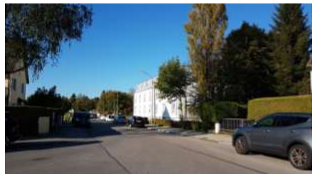
Bauseweinallee Richtung Norden