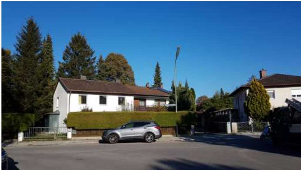
Objekt Bauseweinallee 98