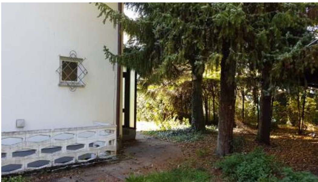
Baumbestand auf dem Grundstück